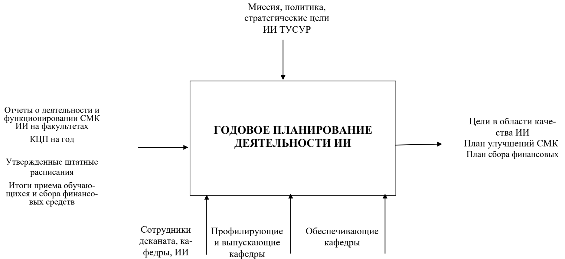
Рисунок 1. Схема процесса Годовое планирование деятельности ИИ